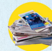
Papiers, journaux, magazines