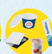
Pots et boîtes