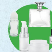
Flacons de cosmétique

(déodorants, pots et flacons, vernis à ongles, parfums...)