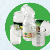
Pots, bocaux, flacons