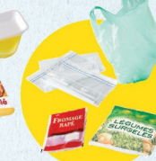
Sacs et sachets